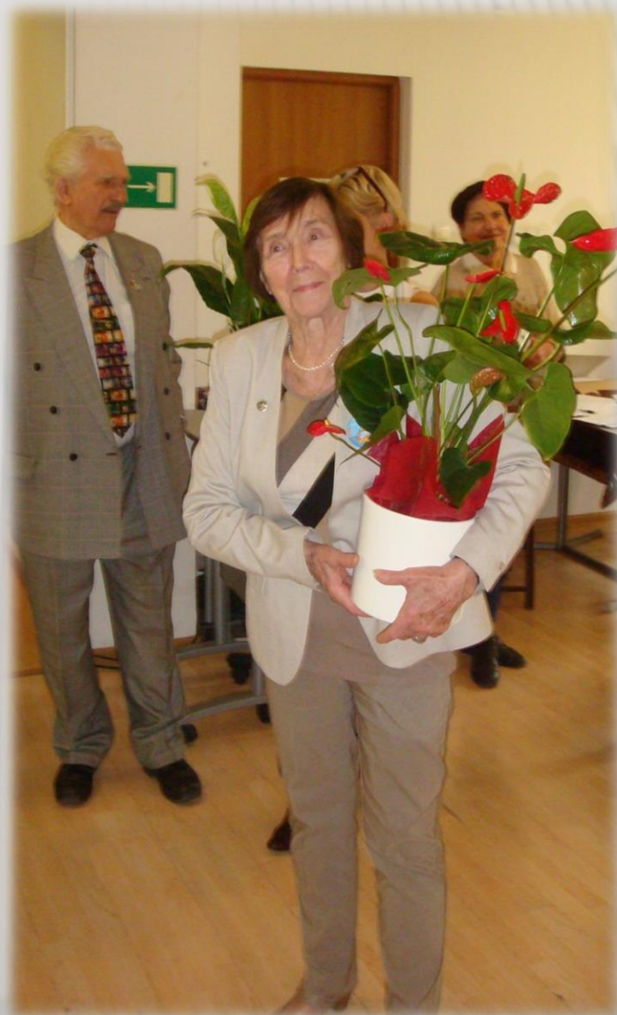
Ponowny wybór na Prezesa ROS - 2017